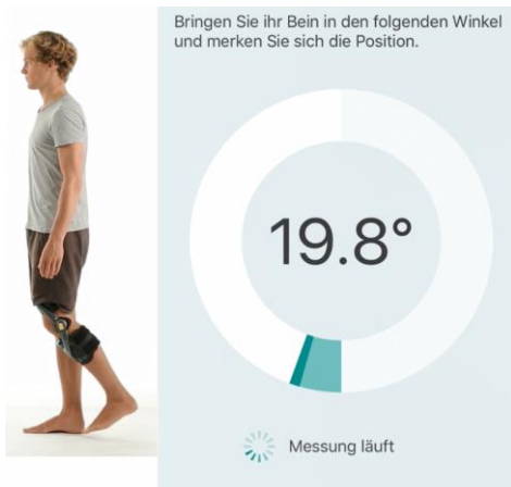
Test 3: Kniewinkelreproduktion